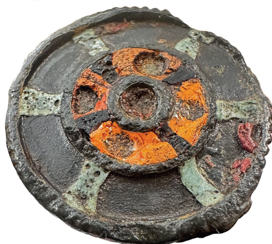
Ryc. 3. Gnojno, pow. buski, stan. 4. Emaliowana zapinka tarczowata (bez skali). Fot.: J. Zagórska-Telega

Fig. 2. Gnojno 4, Busko-Zdrój County. Enamelled disc brooch. Drawing & photo: K. Niziołek