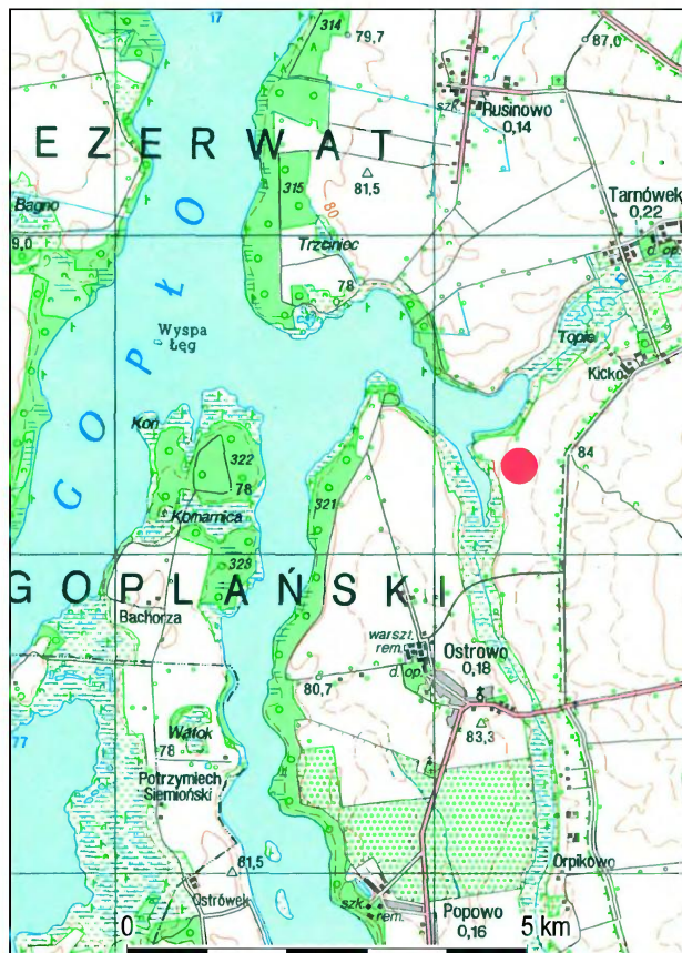
Ryc. 1. Ostrowo, pow. Kruszewica.

W literaturze przedmiotu analogiczne zapinki określa się jako „krzyżowe” lub „czterolistne” (R. A. Širouhov 2011, s. 179). Forma tarczki nawiązuje do kształtu główek późnych wariantów tzw. szpil krzyżowych, datowanych na IX/X–XII wiek a typowych dla obszarów letto-litewskich (A. Bliujienė 1999, s. 122–123). Wpływ na wykształcenie się omawianej odmiany zapinek wywarła zapewne stylistyka tych szpil, jak i oddziaływania skandynawskie (B. Vaska 2004, s. 142). Fibule „krzyżowe” występują w różnych wariantach (również ażurowych) głównie na terytorium Kurlandii, Skalowii i Zemgalii, gdzie datuje się