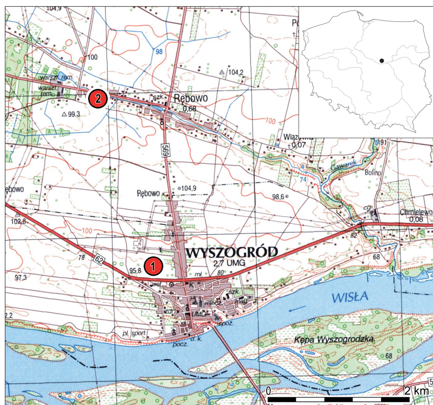
Ryc. 1. Lokalizacja znalezisk z Rębowa (1) i Wyszogrodu (2), w pow. płockim Fig. 1. Findspots in Rębowo (1) and Wyszogrod (2), Płock County